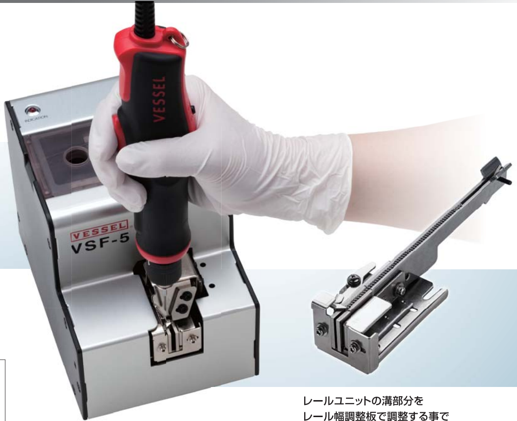
レールユニットの溝部分を レール幅調整板で調整する事で ネジサイズの変更がおこなえます。