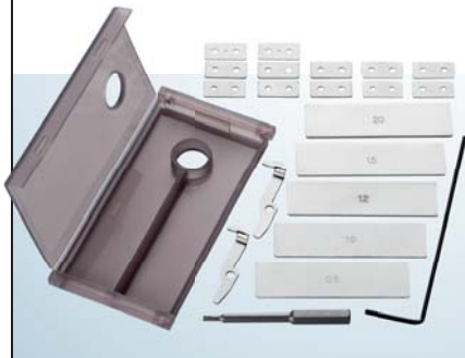
ネジサイズの変更に必要な部品を収納